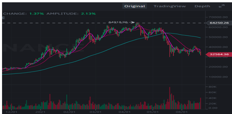
〈최근 6 개월 간 비트코인 가격 변동(자료 : Binance.com) 1) 〉